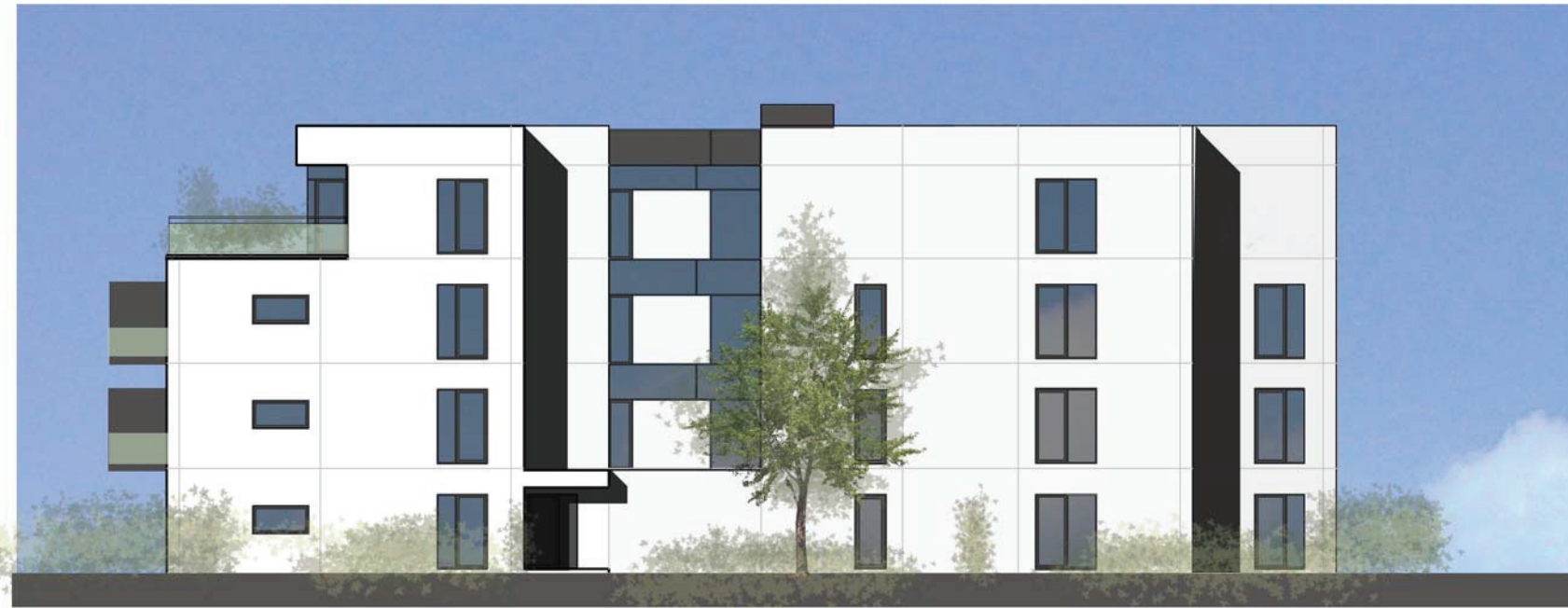
B sydøst indgang