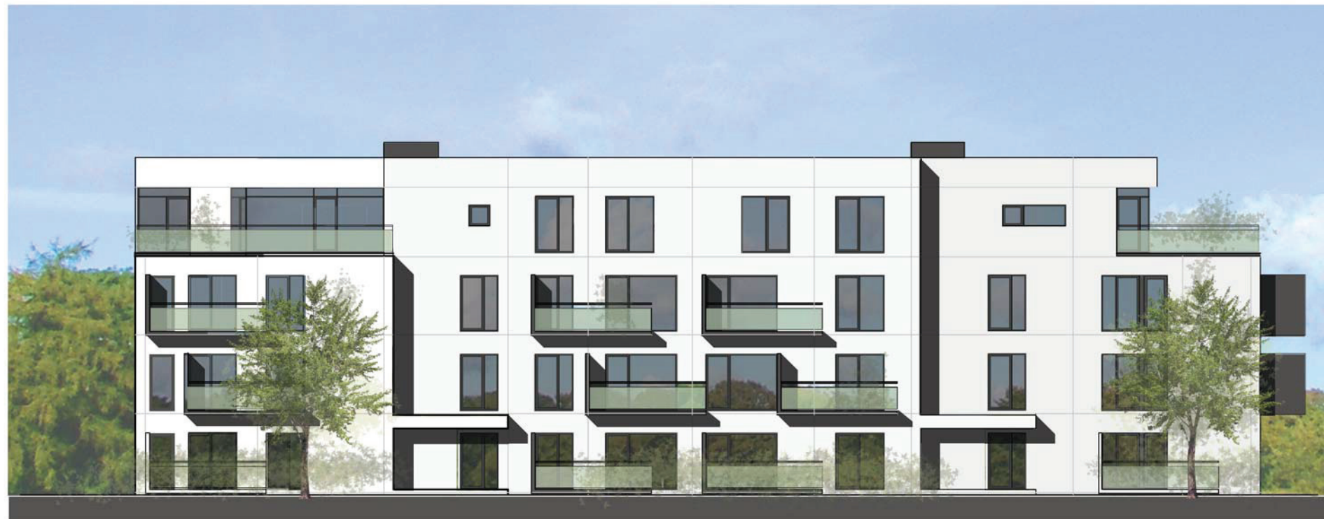
A nordvest indgang